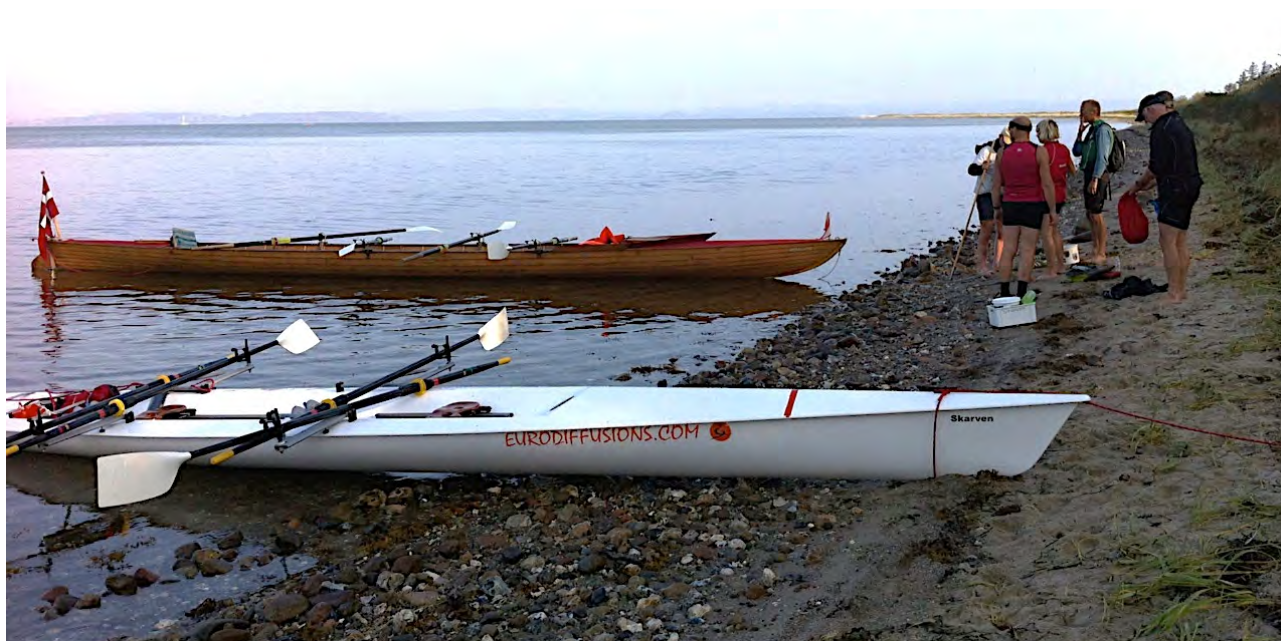
Skarven og Horsens ved Borre Knob 4.10.2014