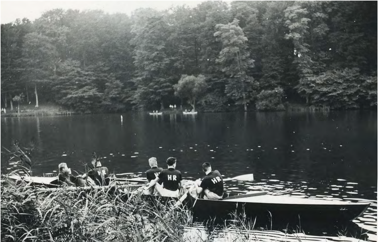
Venskabskaptioning på Bygholm sø 1957