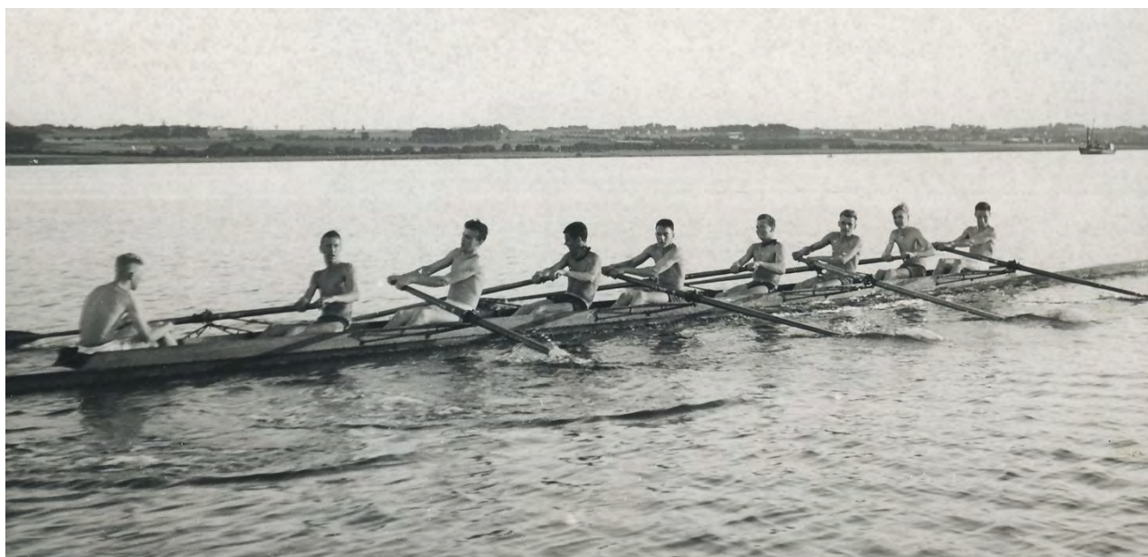
Otter på fjorden 1956

Med EM-medaljerne sluttede en stor epoke i Horsens Roklubs kaproningshistorie. Otteren blev opløst og mandskabet spredt for alle vinde. Dette skete kun et par måneder før klubben fik en ny otter leveret fra et firma i Tyskland. Man håbede at klubben i løbet af et par år kunne samle et nyt mandskab til otteren. Det viste sig desværre ikke at kunne lade sig gøre, og der skulle gå mange år igen før Horsens Roklub kunne gøre sig gældende ved internationale kaproninger.