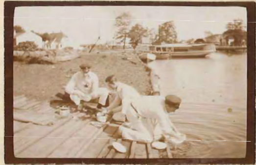
Renlighed er en god Ting.