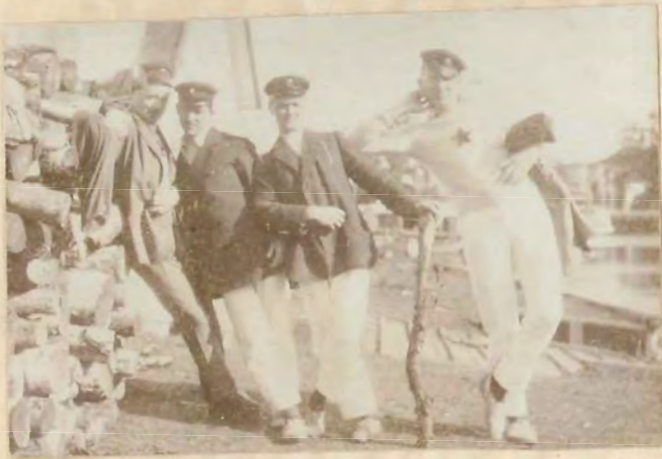
Bel canto indgver Bang Bang.