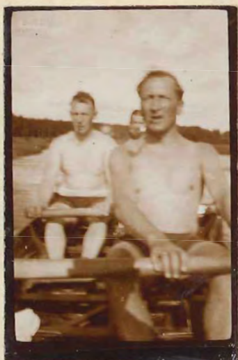
Sejle ned ad Aaen.