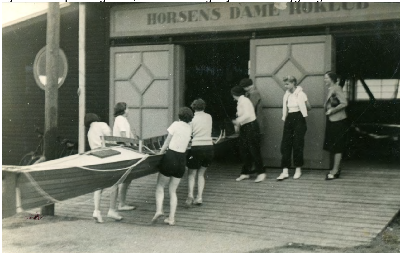
Horsens Dameroklub ca. 1938

Horsens Dame Roklub havde fra starten 26 medlemmer. Klubhus fik man ved hjælp fra havnens side i form af et skur ved et bådbyggeri, tæt på fiskerihavnen. Horsens Roklub ydede fra starten "lillesøster" hjælp i form af instruktører, styrmænd, og robåde. I løbet af 30'erne øgedes interessen for dameroning betydelig, og i 1935 flyttede man fra fiskerihavnen, og byggede nyt klubhus på Langelinie, mellem HR og sejlklubbens bygning.