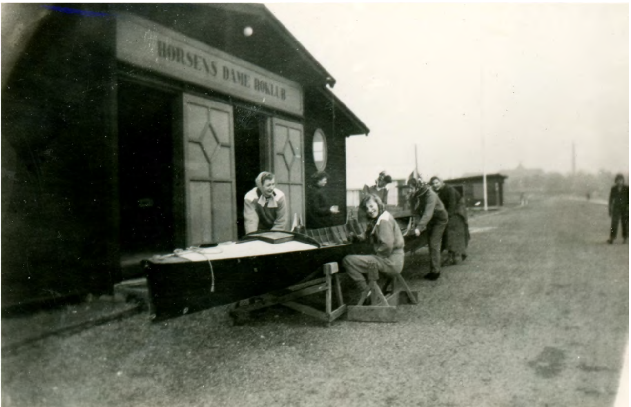
Horsens Dameroklub ca. 1955 - 60