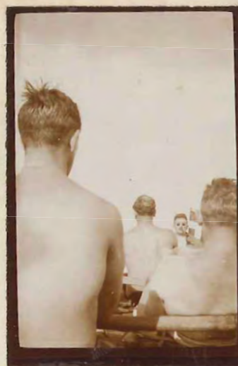
Bagfra Hurra. (Stritter Haaret, saa la mig)