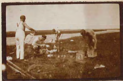
Sidste Frokost, Laxegaarden.