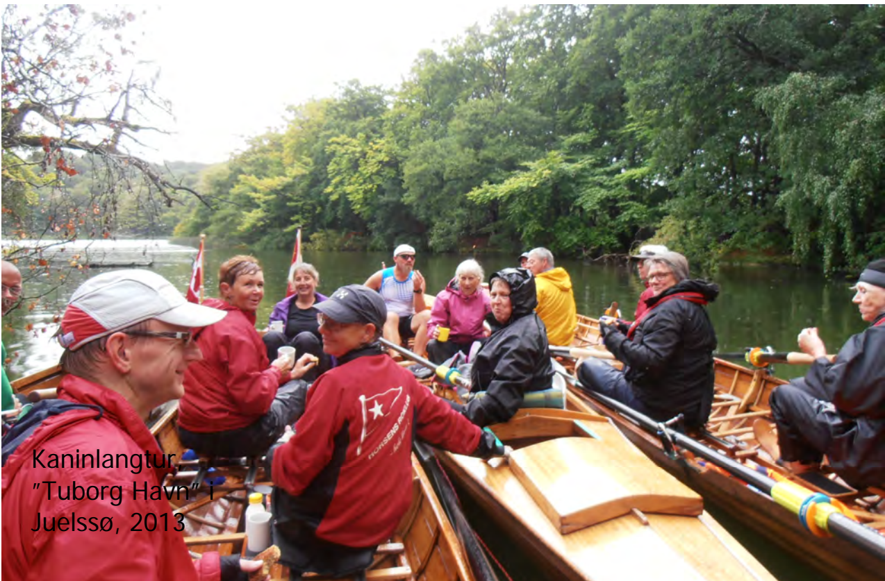
Kaninlangtur "Tuborg Havn" i Juelssø, 2013