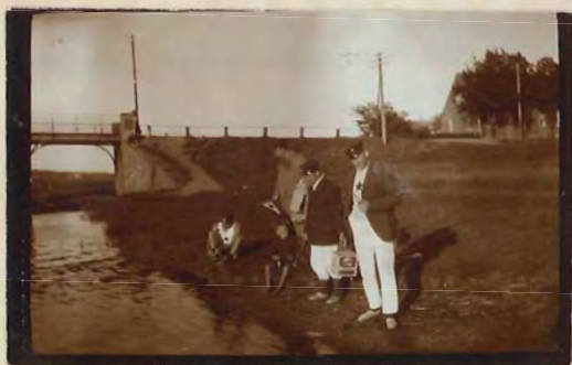
Ankomst Bjerringbro. ("2" i franske Buxer)