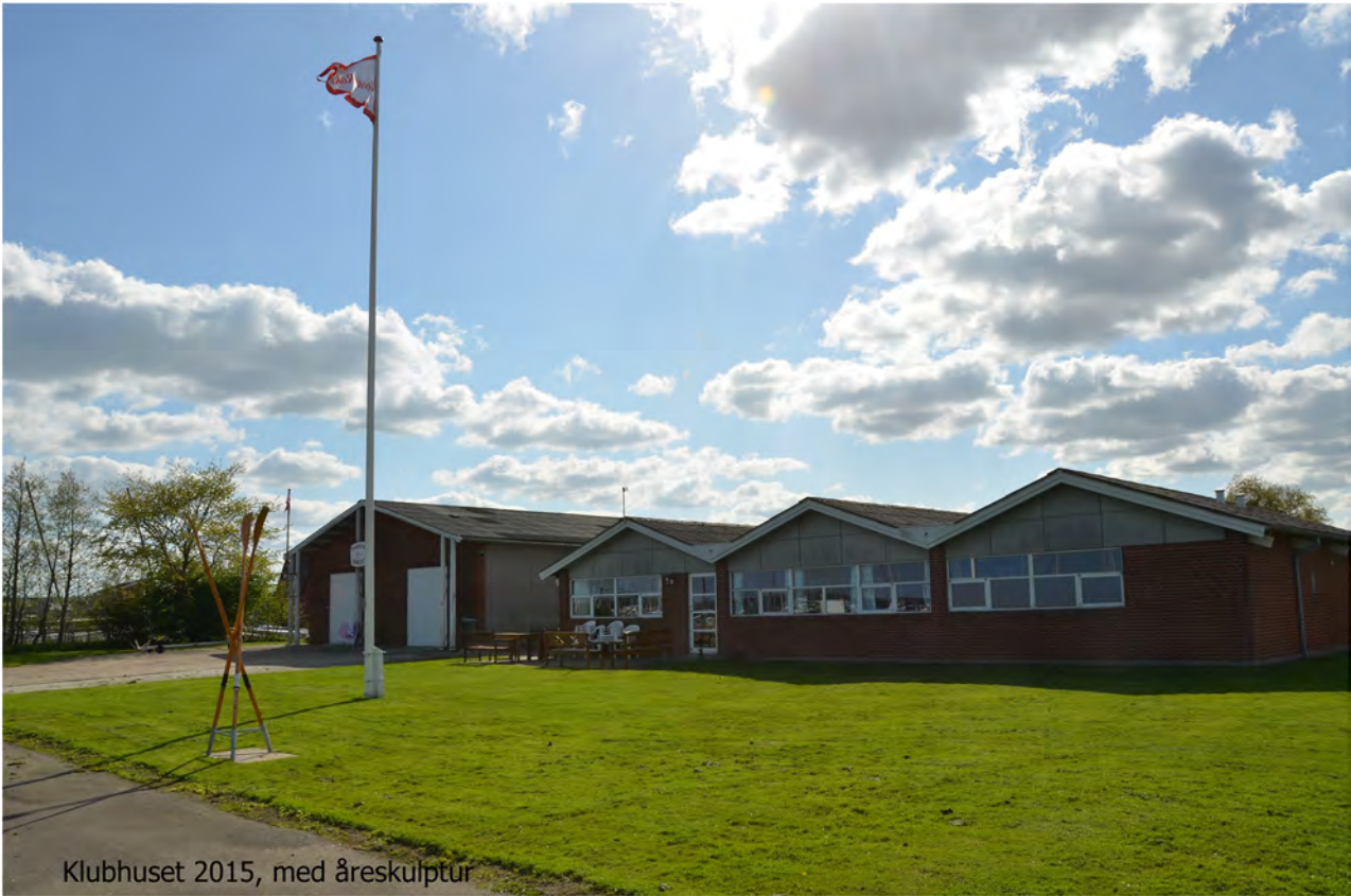
Klubhuset 2015, med åreskulptur