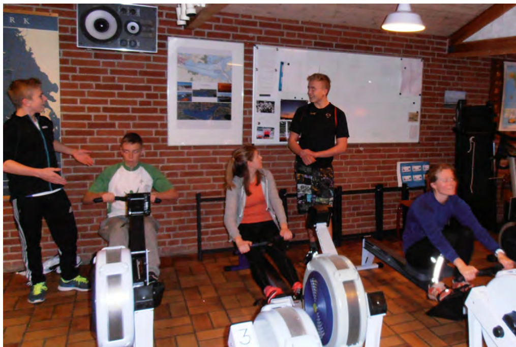
Ungdomstræning i ergometer

I Horsens har vi været med fra starten og haft aktive roere på spinning-instruktørkursus. Rospinning har været en mulighed som vintertræning siden 2008/09. Der har ikke været lige stor tilslutning hvert år, men den seneste vinter har vist os at interessen er stigende. Begrænsningen har det seneste år ligget i antallet af ergometre i klubben. Vi har haft rospinning fire gange om ugen, og mange gange har holdene været overbooket. I vinteren 2014/15 er der roet over 10.000 km i ergometer, vel at mærke registrerede km.