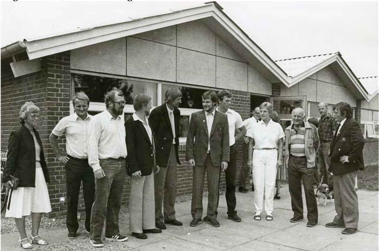
Nyt klubhus, ved indvielsen 1983

Klubhuset var dog ikke helt færdig, lidt manglede, da det var "tyndet ud" i af rækken af hjælpere, og derfor blev den officielle indvielse først foretaget i august 1983, da alt endelig var klar.