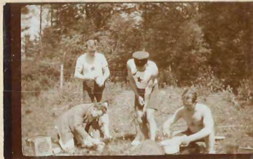
Forberedelserne er de sværeste.