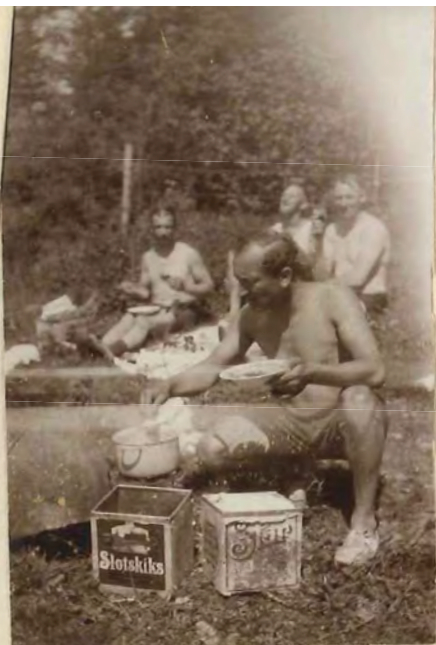
Indianer ved Kogehullet.