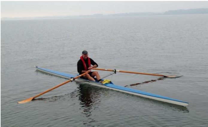
Med tungen lige i munden omkring Husodde

Horsens fjord byder dog på mere – her er tillige også meget kønt at se på - og denne sommer har jo været fantastisk med roligt vand, kun lidt vind og masser af sol og varme ☺